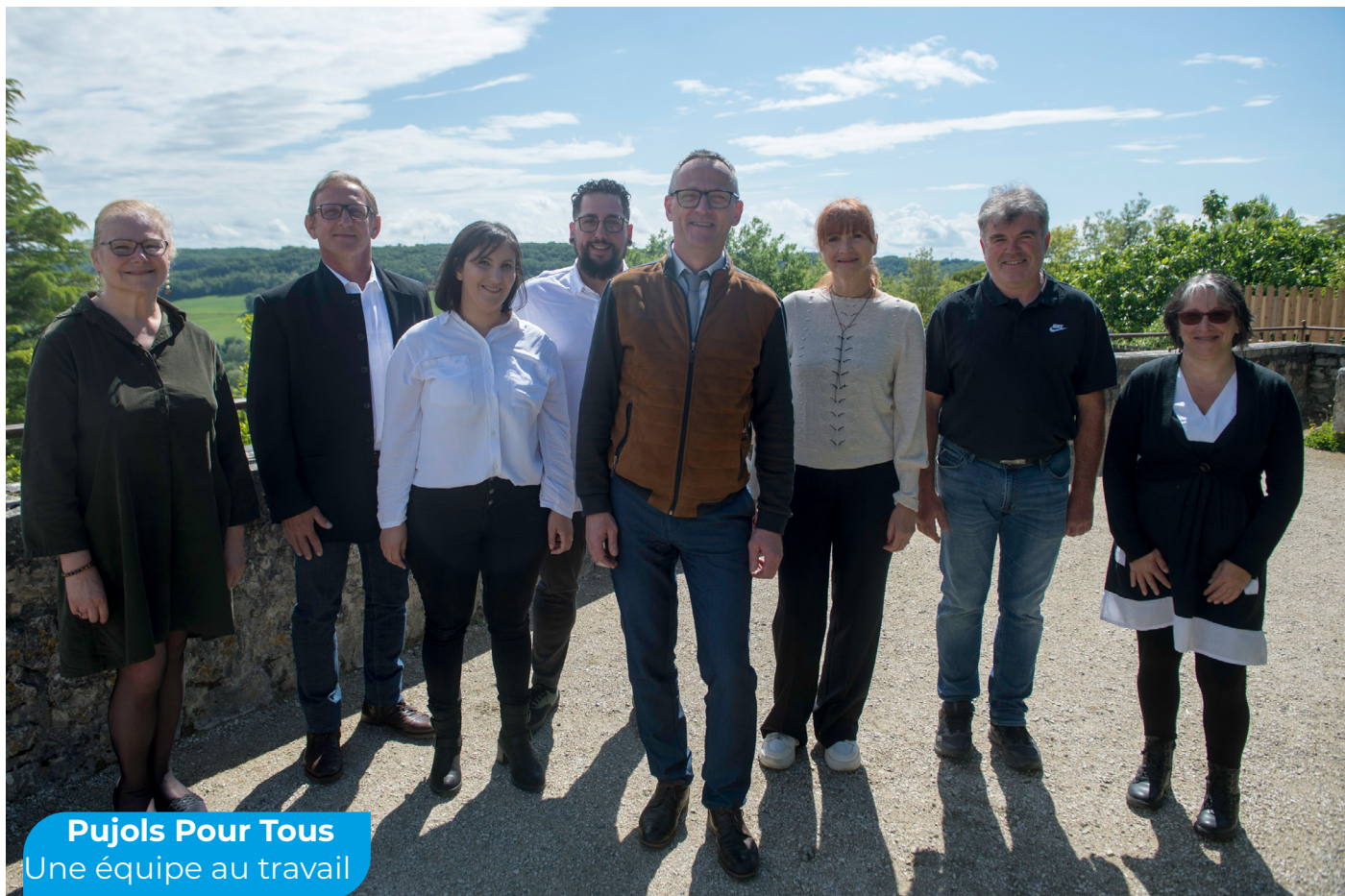
visuel de campagne